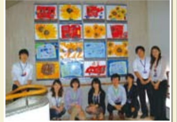
下京区役所庁内市民サービス向上等検討チーム(訪れたくなる庁舎部会)メンバー