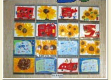
ひまわりや消防車、プール遊びの様子が元気にいっぱい描かれています。

作品をご覧になって感じたことを話題にご家庭での会話や弾み、家族及び地域との絆を感じていただければ幸いです。